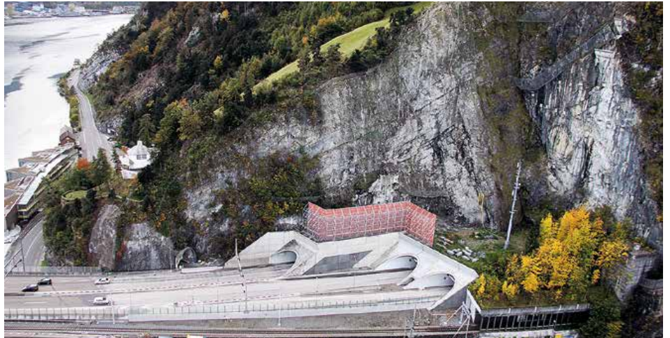
Gesamtüberblick der Baustelle