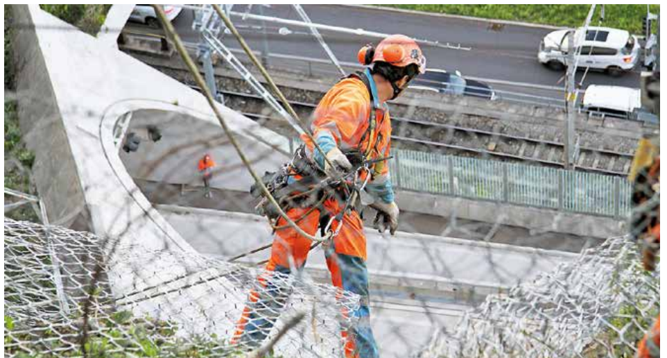
Vorlegen der Netzabdeckungen in der Felswand