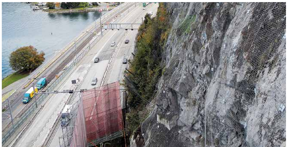
Felswand direkt über der Autobahn