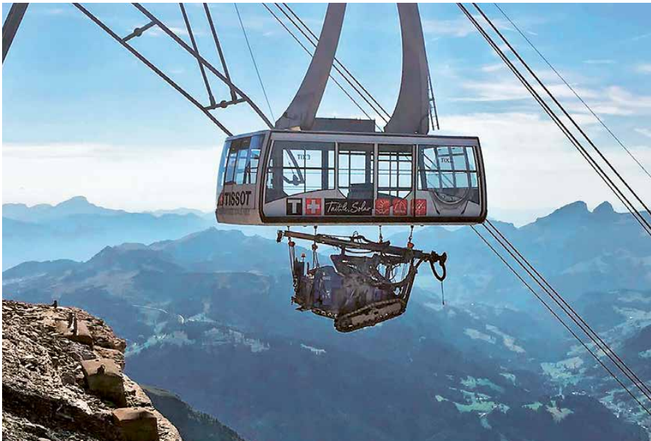
Transport Raupenbohrgerät Sandvic 302 mit der Seilbahn

konnte das Material sowie Inventar über eine temporäre Baupiste zur Baustelle verschoben werden. Unsere Hauptaufgabe bestand darin, auf einer Strecke von 210 m Länge ein 16 m breites Pistentrassée mit 40 % Längsgefälle in den