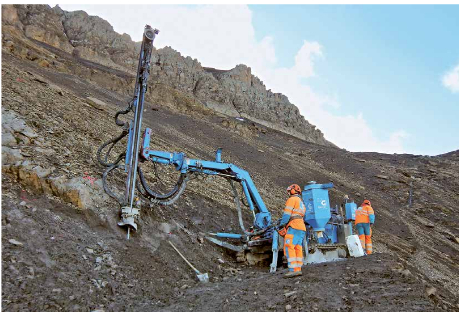
Bohrarbeiten für die erste Sprengung