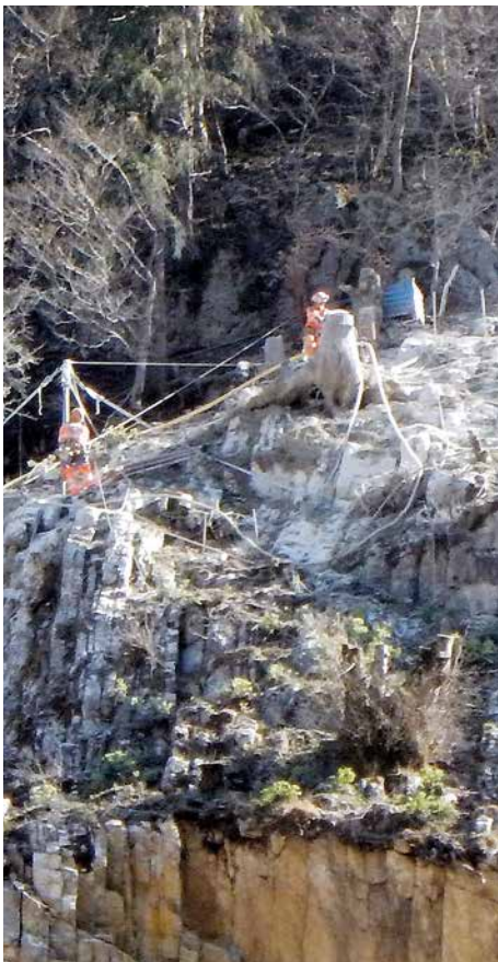
Viel Handarbeit beim Bohren im Steilhang